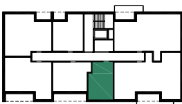
BUDYNEK E (NR 9)