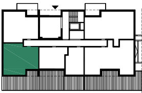
BUDYNEK E (NR 9)