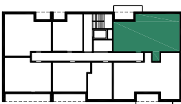
BUDYNEK E (NR 9)