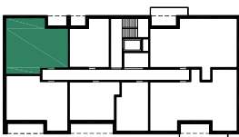
BUDYNEK E (NR 9)