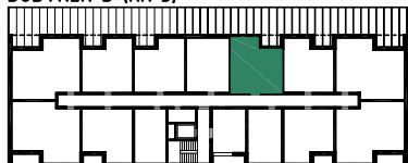
BUDYNEK B (NR 3)