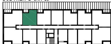
BUDYNEK B (NR 3)