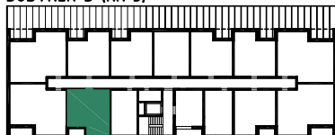
BUDYNEK B (NR 3)